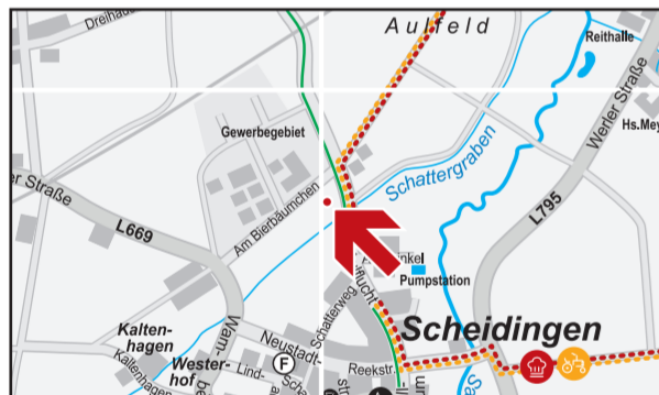
unten Der Mittelpunkt von Westfalen in Welver-Scheidingen (Auszug aus der Welver-Radwanderkarte)